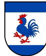
Dobrá Voda u Hořic